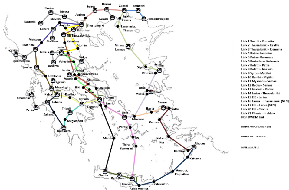
Εικόνα 2 Δίκτυο Οπτικών Ινών ΕΔΕΤ (WAN)

Για την εξυπηρέτηση των αναγκών του δικτύου κορμού και του δικτύου πρόσβασης του, η ΕΔΥΤΕ ΑΕ έχει αποκτήσει με μακροχρόνια Σύμβαση “σκοτεινές” οπτικές ίνες (dark fibre). Στο δίκτυο αυτό υλοποιούνται: (α) συνδέσεις Ευρείας Ζώνης (WAN), (β) μητροπολιτικές (MAN) συνδέσεις, και (γ) συνδέσεις Φορέων. Στην Εικόνα 2 απεικονίζεται το αποτύπωμα (footprint) των οπτικών ινών του δικτύου ΕΔΕΤ.